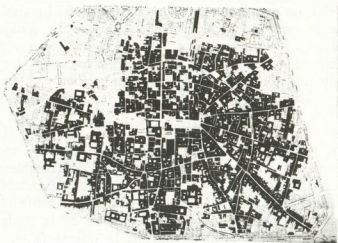
Figs. 11-12. Bologna. El organismo ciudadano en la primera parte del 800 y el centro histórico actual, donde los edificios antiguos protegidos (en negro) todavía forman un sistema unitario.

corresponde, en parte, a la ciudad antigua, es decir, que forman un sistema coherente en el cual las calles nuevas aparecen como episodios parciales. Los bordes de la población todavía están marcados por las murallas y los fosos, o por las avenidas y los espacios verdes que los han reemplazado; las casas antiguas todavía forman la mayor parte del tejido edilicio actual, de manera que las casas modernas se distin-